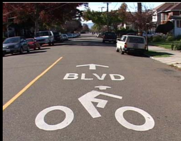
Berkeley, California, EUA