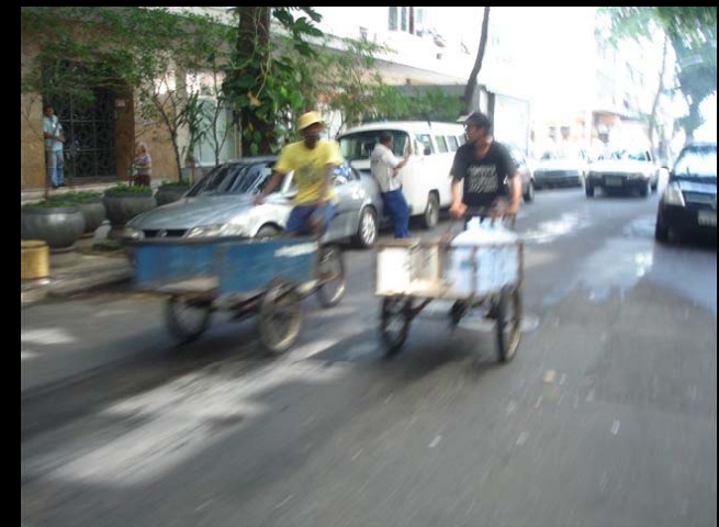
Rua Ronald de Carvalho.