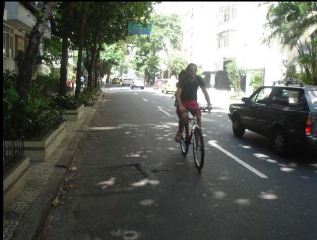
Rua Hilário de Gouveia,