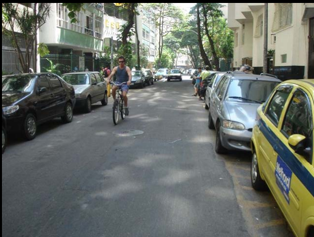
Rua Domingos Ferreira,