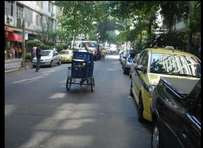
Rua Belford Roxo