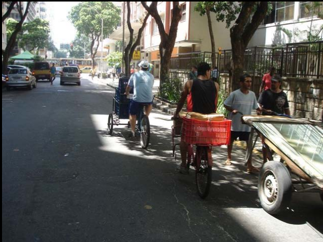
Rua Constante Ramos,