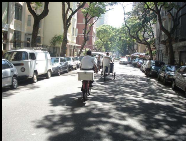
Rua Min. Viveiros de Castro,